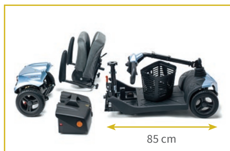
Desmontable en 4 piezas