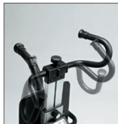
Timón regulable en altura y ajustable para adaptarlo al cuidador.