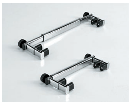
Barra ajustable para el Yack 962 y Yack 963.