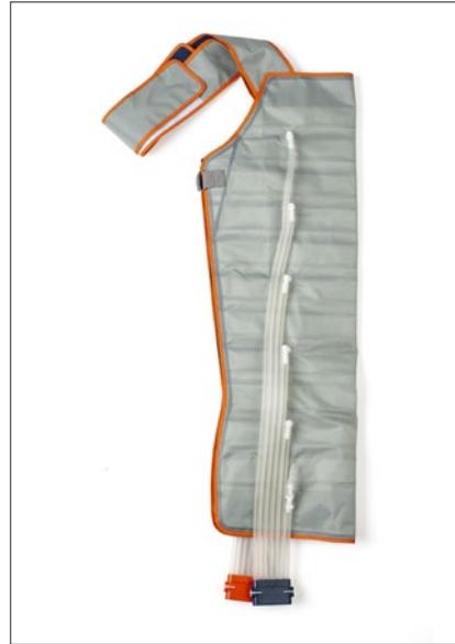
Manguito Brazo y Hombro