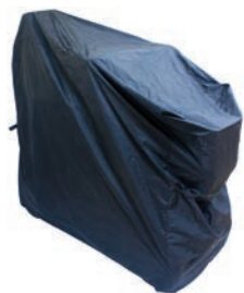
Funda de almacenaje