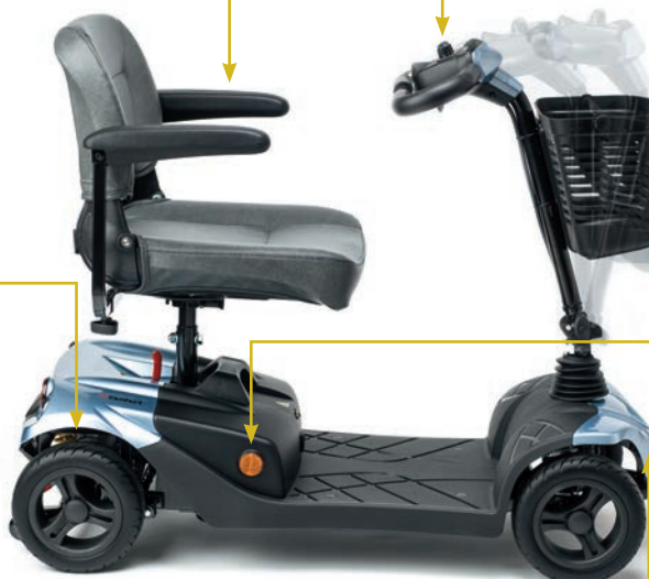
Columna de conducción