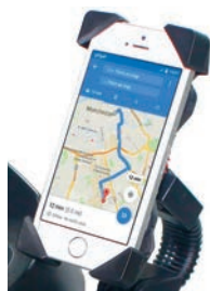
Soporte para móvil