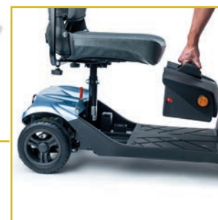
Baterías extraíbles para facilitar su recarga