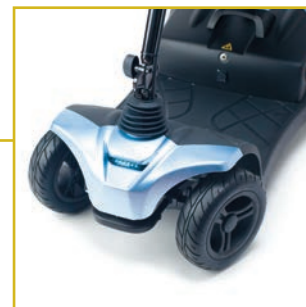
Luz led delantera