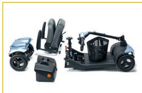
Desmontable en 4 piezas