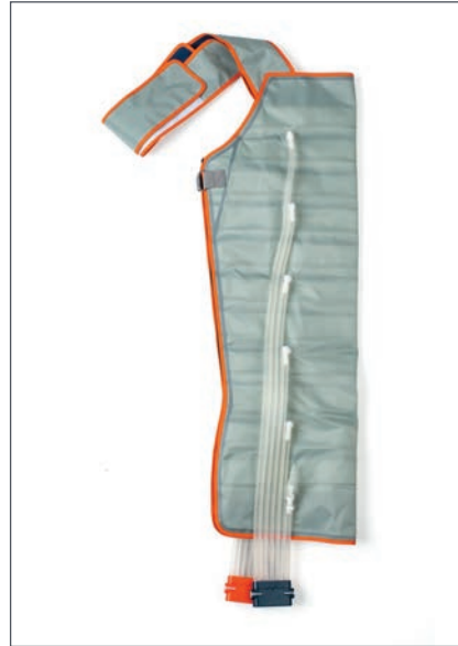
Manguito Brazo y Hombro