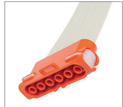
Conector seguro a prueba de torsión