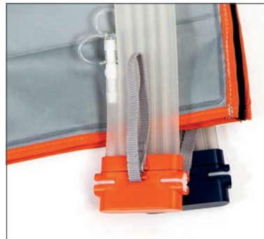
Fundas de Calidad Premium