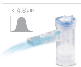
Excelente aprovechamiento del medicamento