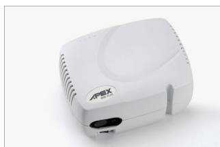
Compresor portátil, compacto y duradero