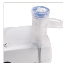
Cómodo diseño para sujetar el vaso